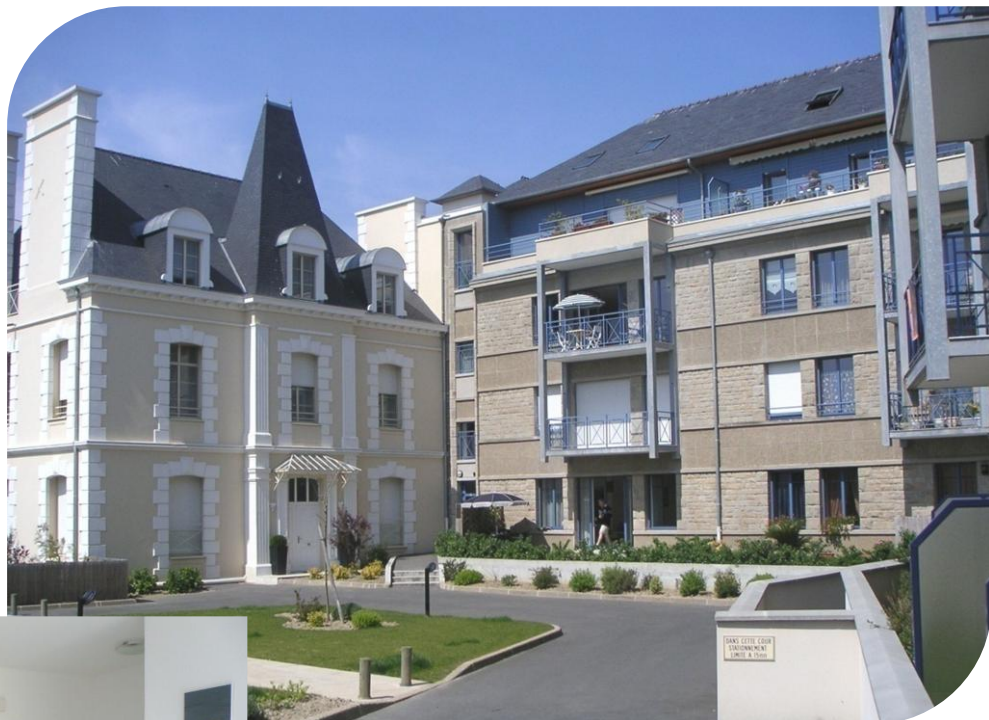
Entrée de la résidence