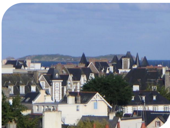
Vue de mer sur l'île de Cézembre

Appartement au 1 er étage, entrée commune dans une résidence de standing 3 étages avec vue de mer