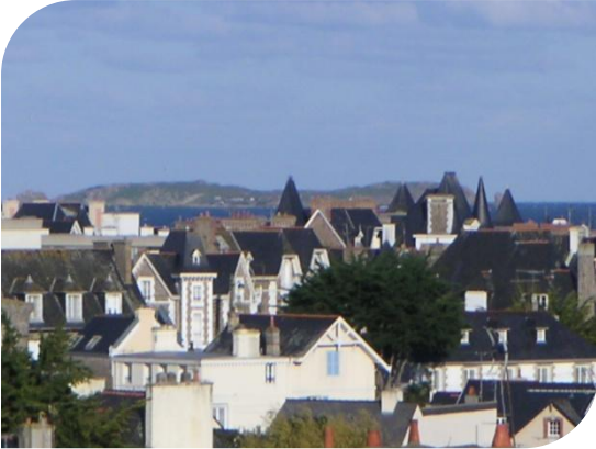
Vue de mer sur l'île de Cézembre

Appartement au 1 er étage, entrée commune dans une résidence de standing 3 étages avec vue de mer