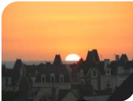
Coucher de soleil vu de l'appartement