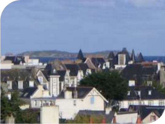
Vue de mer sur l'île de Cézembre