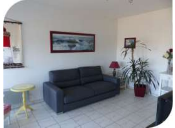
Le salon avec TV écran plat

Appartement au 1 er étage, entrée commune dans une résidence de standing 3 étages avec vue de mer