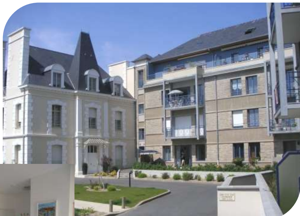
Entrée de la résidence