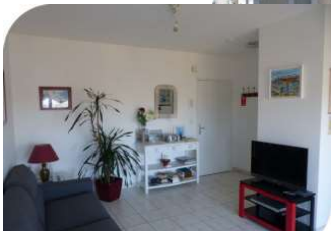
Le salon avec TV écran plat

Appartement au 1 er étage, entrée commune dans une résidence de standing de 3 étages