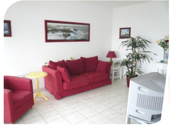
Le salon avec TV écran plat "canalready"