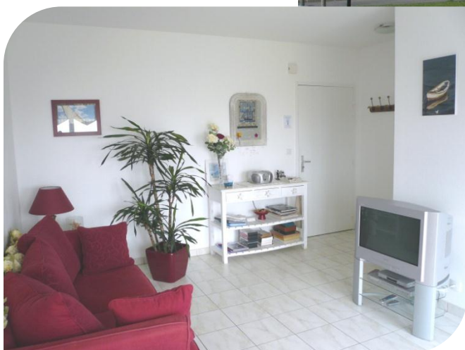
Le salon avec TV écran plat

Appartement au 1 er étage, entrée commune dans une résidence de standing de 3 étages